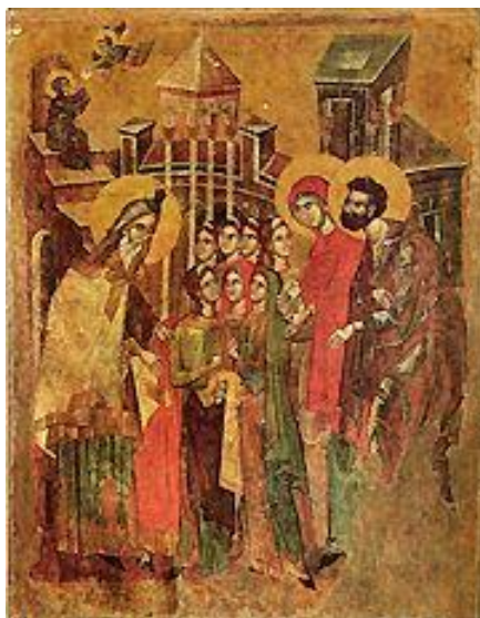
The Entrance of the Theotokos into the Temple

The Entrance of the Theotokos into the Temple, also called The Presentation , is one of the Great Feasts of the Orthodox Church , celebrated on December 4th.